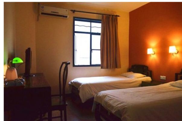
shuāngrén jiān 双人间 double room