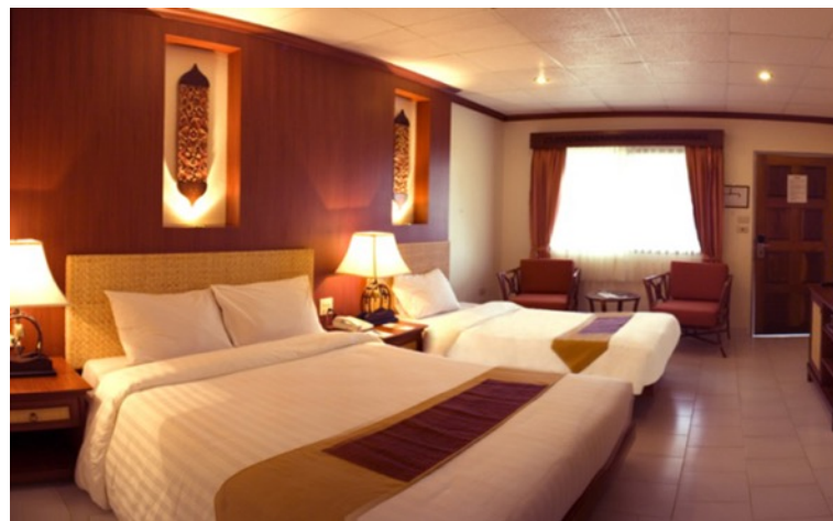
biāozhǔn jiān 标准间 double room